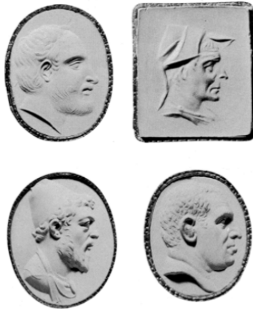
插图 350 展示了四个镶嵌在图章戒指中的石头，上面各刻有画像。左上图显示的是一个公元前五世纪的男人。右上图是希腊化时期的一位希腊陆军元帅。左下图是一位富有的希腊人。右下图则是一位精力旺盛的男人，可能还是个罗马人。这样的戒指被用来在蜡块或泥土上刻下独特的标记，成为印记，很像现今法律文件上的签名。

人会用七枚图章戒指将卷起来的书卷封上。当立遗嘱的人过世时，这七位可靠友人会被召集在一起。每个人都要声明遗嘱上面的印章是否真的未经篡改。在这之后，书卷才能被打开，遗产才能按照遗嘱进行分配。 349